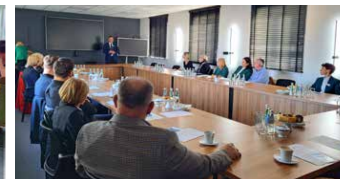
Drugie spotkanie: 22 listopada 2023 roku (zdjęcie po lewej wykład online przeprowadzony w Oddziale w Łęczycy, po prawej w Centrali Banku w Lututowie)