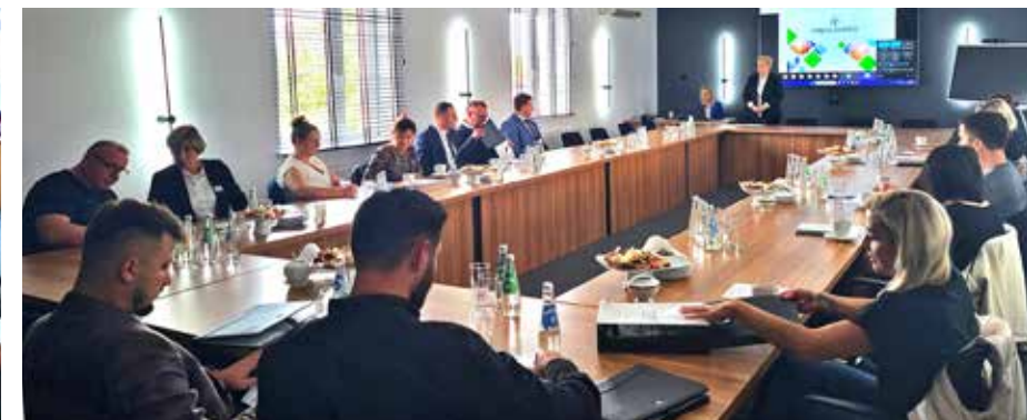
Pierwsze spotkanie: 5 października 2023 roku (zdjęcie po lewej wykład online przeprowadzony w Oddziale w Łęczycy, po prawej w Centrali Banku w Lututowie)