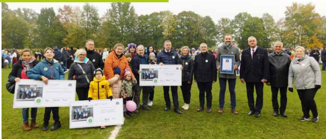
Wręczenie czeków bohaterom akcji

„Mieliśmy położone ponad trzy linie monet, także wszystko prawidłowo zostało ułożone i policzone. 1356,1 metrów to świetny wynik, więc serdeczne gratulacje”.