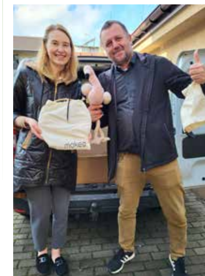
Przekazanie akcesoriów dziecięcych

Mówiąc o sukcesie Kilometra Złotych Serc, nie tyle skupiam się na liczbie złotych, choć to istotna sprawa w leczeniu i rehabilitacji chorych dzieci, ile na wielowarstwowości tej niesamowitej akcji. Zaczynamy od tego, że spowodowała ona prawie spontaniczne spotkanie setek ludzi na lututowskim stadionie. Przyjechali układać monety, bić rekord, a jednocześnie poznać się. Byliśmy dla siebie wszyscy na wyciągnięcie ręki. Zdrowe i chore dzieci, urzędnicy i mieszkańcy, pracownicy instytucji, takich jak choćby Lasy Państwowe i strażacy, policjanci i dziennikarze. W dobie internetowych relacji międzyludzkich podawaliśmy sobie z rąk do rąk ciepłą herbatę, śpiewaliśmy i tańczyliśmy. Poculiśmy to, co najistotniejsze – wspólnotę i wspólną za siebie odpowiedzialność. Mogliśmy wreszcie porozmawiać z tymi, którym pomagamy i tymi, którzy się nimi opiekują. Budząc zainteresowanie mediów, pokazaliśmy się z najlepszej strony, jako miejsce na ziemi, które warto jest poznać ze względu na ludzi i ich otwartość. A już idąc za mentorem i myślą jednego z największych przyjaciół najmłodszych, czyli za Januszem Korczakiem, to spowodowaliśmy, że uśmiechnięty był nie tylko cały świat, ale i kilka galaktyk. Gdzie nie zaglądnąłem, gdzie nie podszedłem, tam było pełno dzieciaków, a każde miało uśmiech na twarzy. A przecież wiadomo, że gdy śmieje się dziecko, śmieje się cały świat.